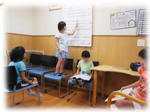
朝の会スケジュール